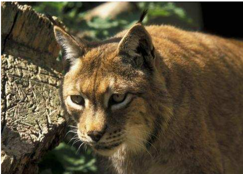
Le lynx a été repéré pour la première fois le 1er mars 2011

Un lynx, responsable de la mort d'au moins trois agneaux, a été aperçu jeudi dans le Rhône. C'est la première fois que cet animal est aperçu dans ce département.